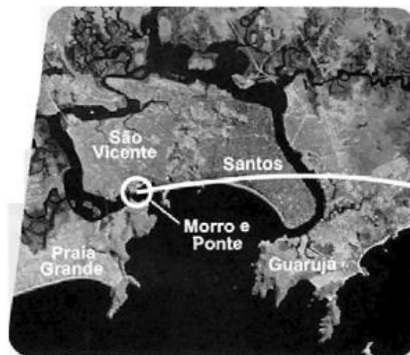
IMAGEM DE SATÉLITE

25) Considere os exemplos das figuras e analise as frases abaixo, relativas às imagens de satélite e às fotografias aéreas.